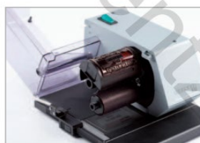
Roue moleté et clavette coulissante pour ajustage de la date